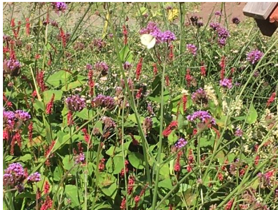
Vlinders in het perk Tuindorpweg